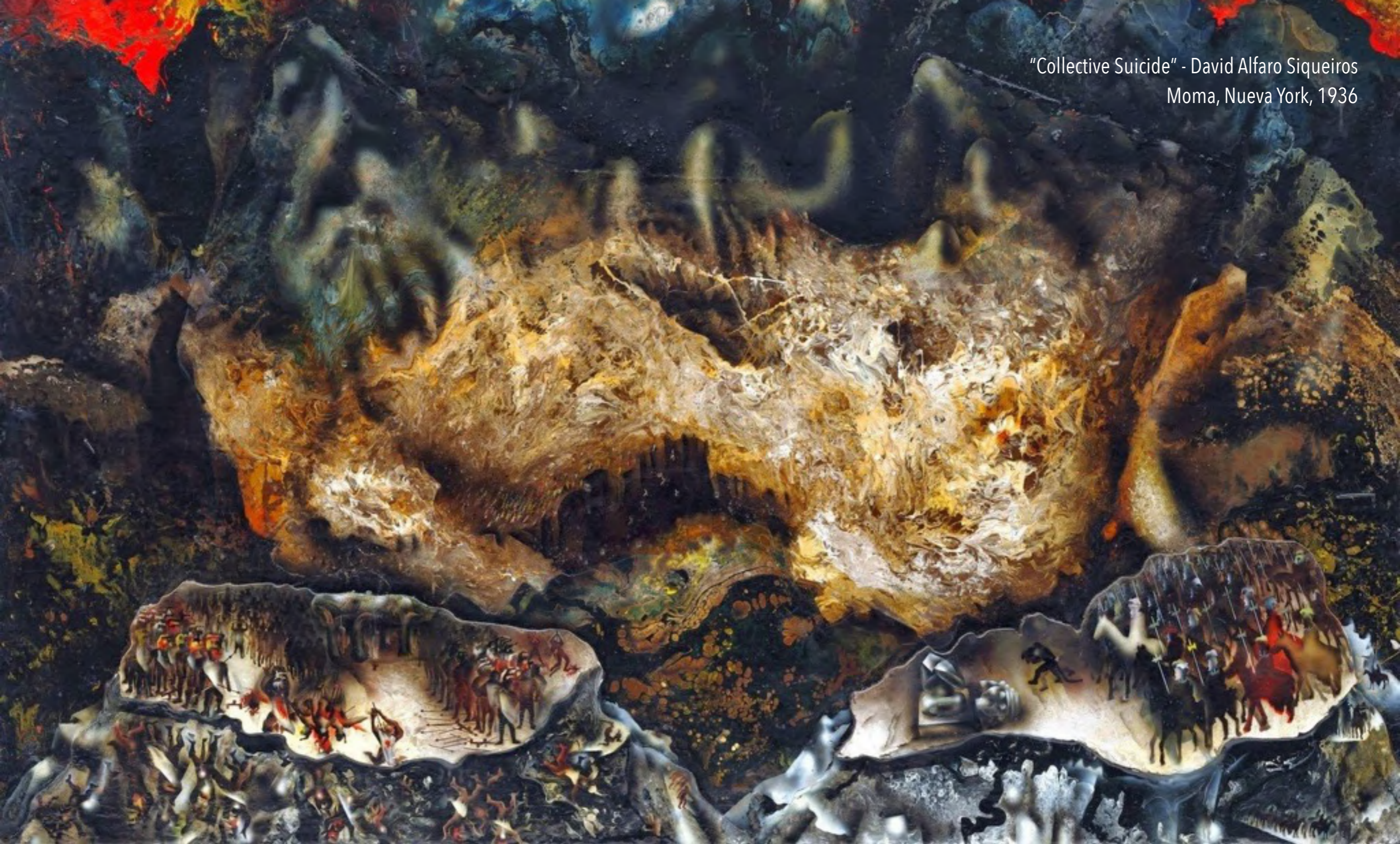
"Collective Suicide" - David Alfaro Siqueiros Moma, Nueva York, 1936

EIM - Encuentro Interdisciplinario sobre la Muerte 4ª versión: "La voluntad humana ante la Muerte"