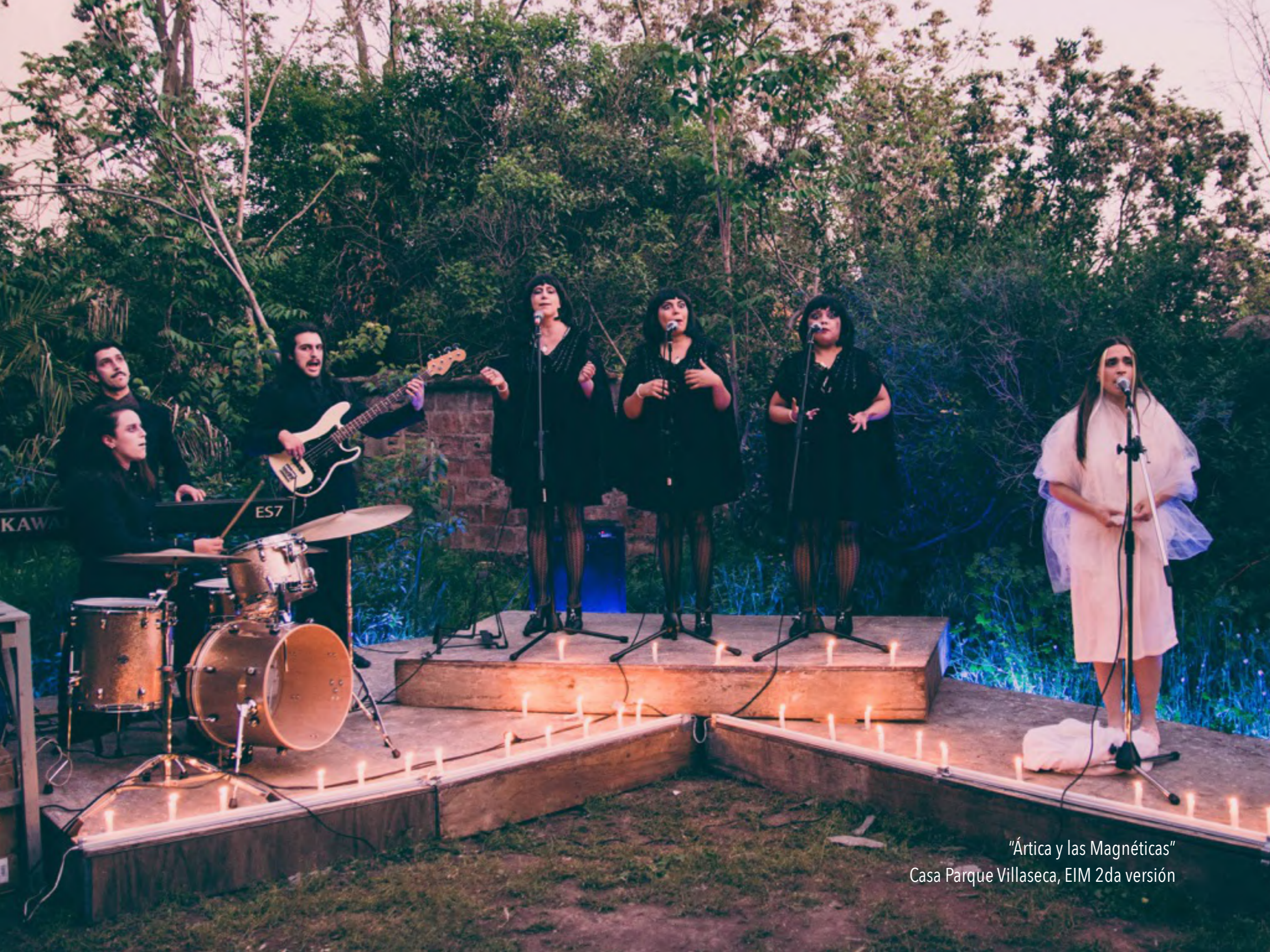
"Ártica y las Magnéticas" Casa Parque Villaseca, EIM 2da versión