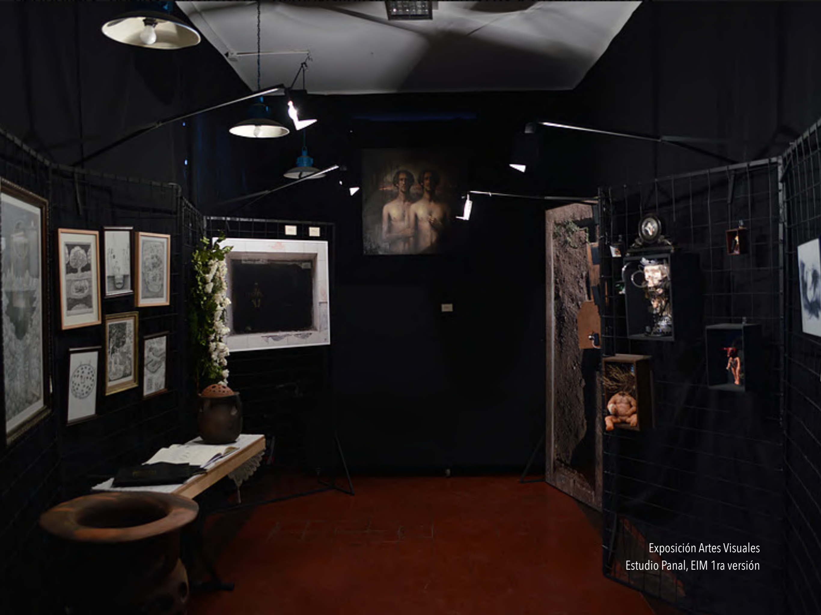
Exposición Artes Visuales Estudio Panal, EIM 1ra versión