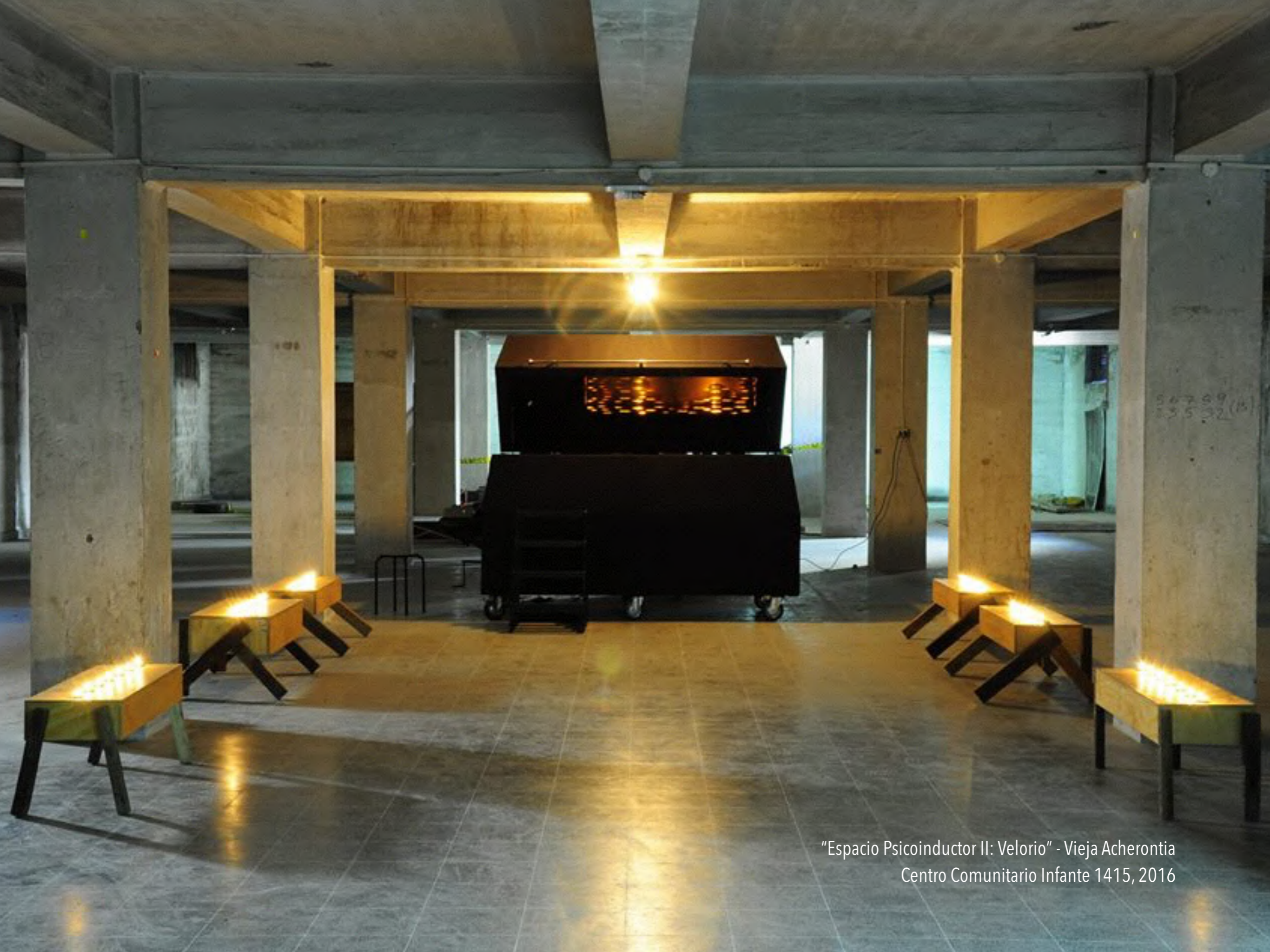
"Espacio Psicoinductor II: Velorio" - Vieja Acherontia Centro Comunitario Infante 1415, 2016